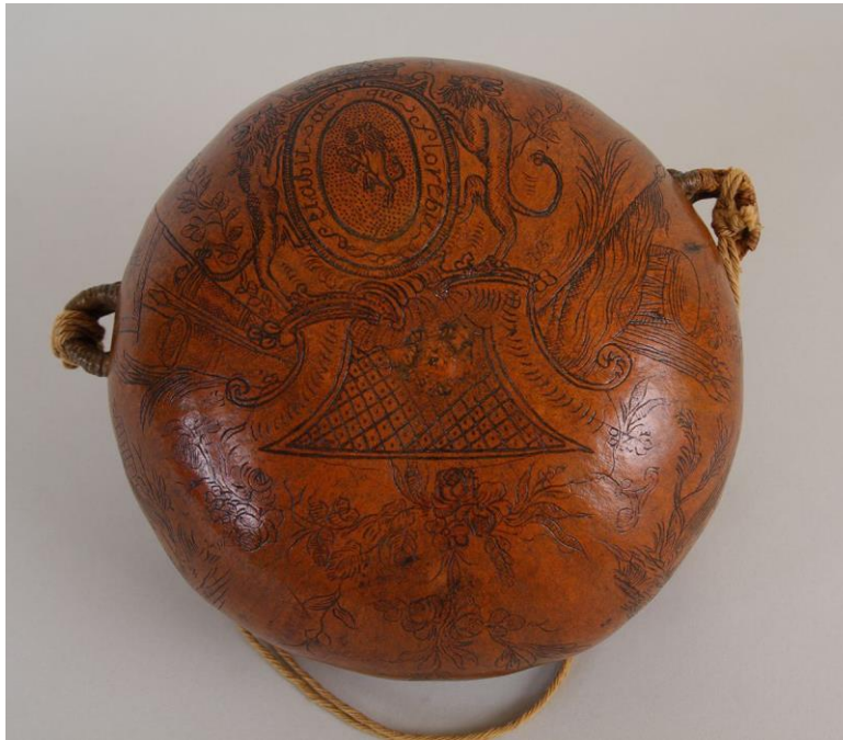
Dessous - Musée Stewart, île Sainte-Hélène, Montréal (Québec)

contenant décoré, une petite maison, des lances et des canons. Voir les illustrations 1 et 2.)